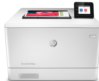
HP Color LaserJet Pro M454dw

Imprimante avec sécurité dynamique activée. Uniquement destinée à être utilisée avec des cartouches dotées d'une puce authentique HP. Les cartouches dotées d'une puce non HP peuvent ne pas fonctionner et celles qui fonctionnent actuellement pourraient ne plus fonctionner à l'avenir. Pour en savoir plus, consultez: