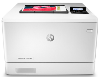
HP Color LaserJet Pro M454dn

Le secret de la réussite d'une entreprise : travailler intelligemment. L'imprimante HP Color LaserJet Pro M454 est conçue pour vous laisser vous consacrer aux tâches assurant la croissance efficace de votre entreprise et vous permettant de rester en tête de la concurrence.