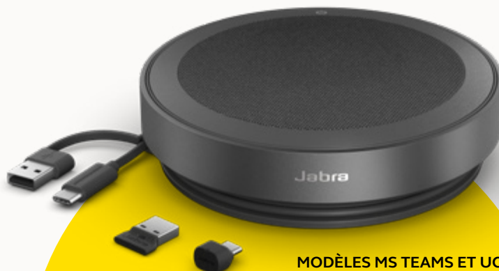
MODÈLES MS TEAMS ET UC

Pour apporter notre contribution à la protection de l'environnement, nous veillons à réduire notre empreinte écologique à chaque étape de la fabrication de nos produits. Le revêtement du Speak2 75 est composé de plus de 33 % de matériaux durables 3 et d'un nombre important de pièces réparables ou remplaçables. Voilà l'équation magique : préservation de l'environnement = durée de vie prolongée = qualité d'appels supérieure sur la durée, pour vous et votre équipe.