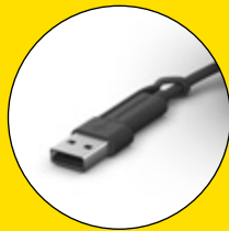
Connecteurs USB-C et USB-A fournis